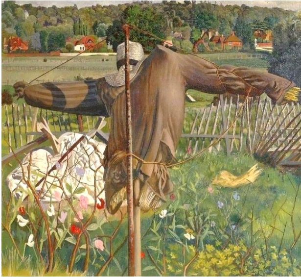
De vogelverschrikker, 1934