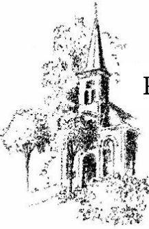
Protestantse gemeente Koudum