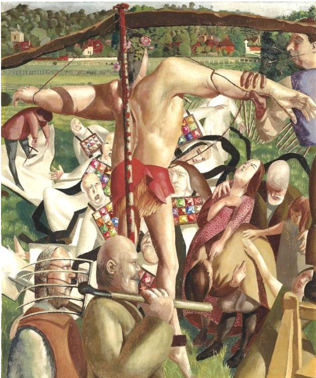
De kruisiging, 1934