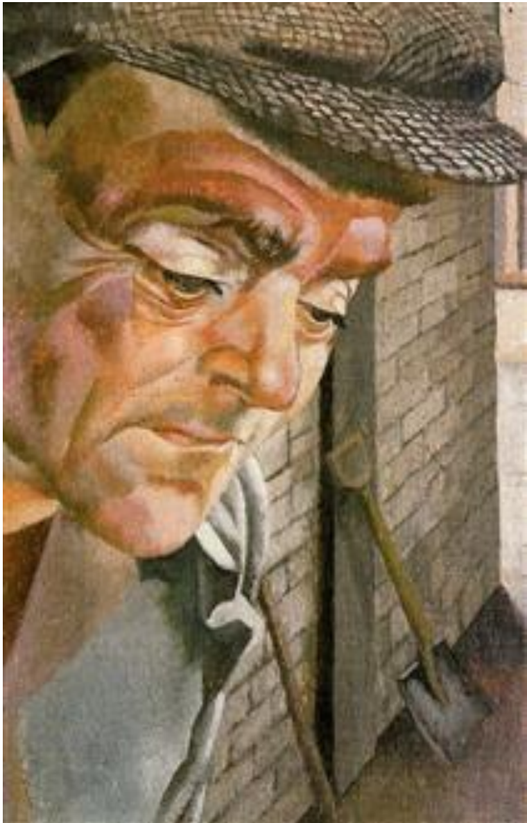
De stoker, 1945